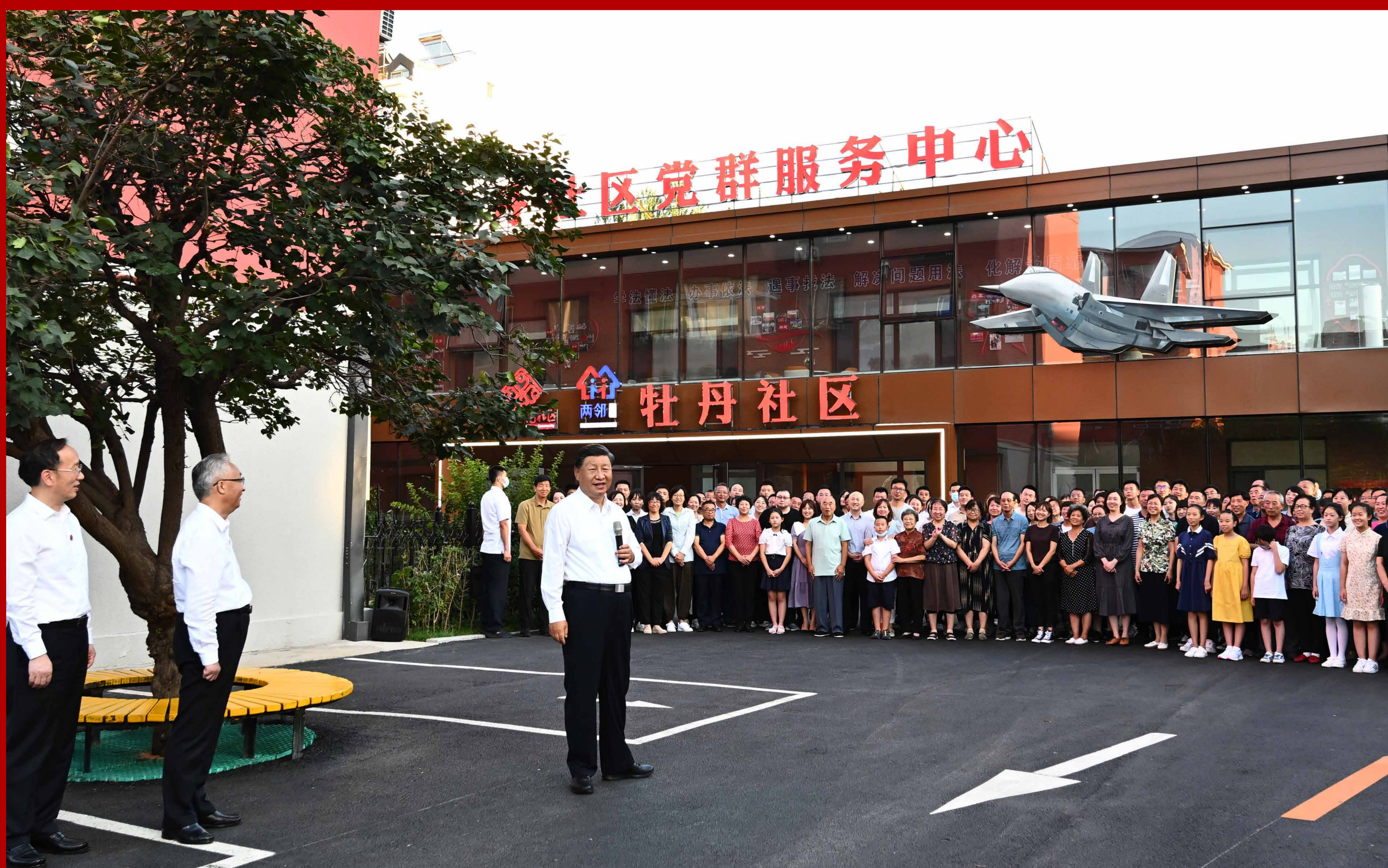
2022年8月17日下午，习近平总书记来到沈阳市皇姑区三台子街道牡丹社区考察。牡丹社区是典型的老旧小区，近年来，经过改造，已成为远近闻名的基层治理示范社区。离开牡丹社区时，面对热情欢送的居民们，习近平总书记强调，小康梦、强国梦、中国梦，归根到底是老百姓的“幸福梦”。