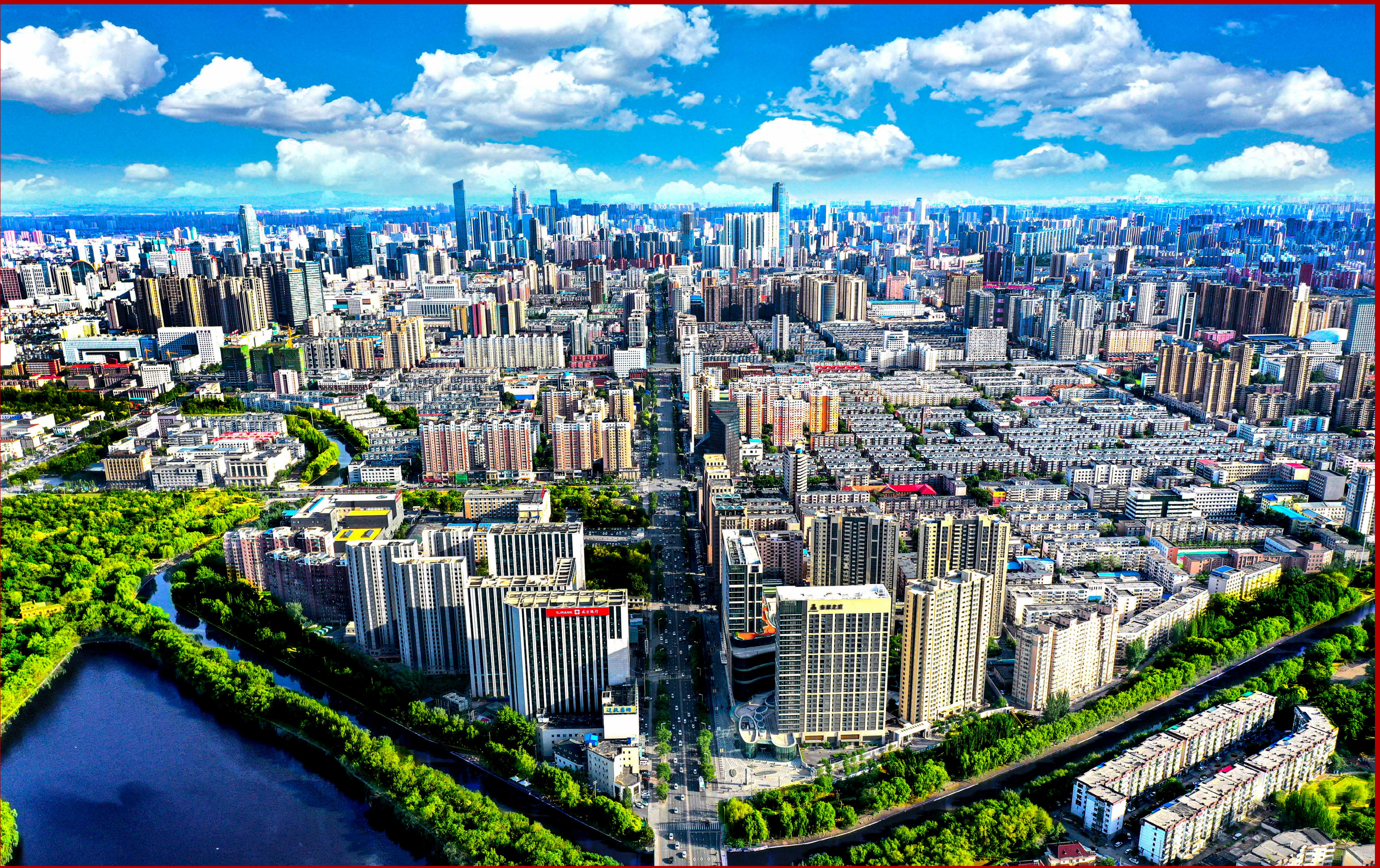
从北运河鸟瞰沈阳市区。