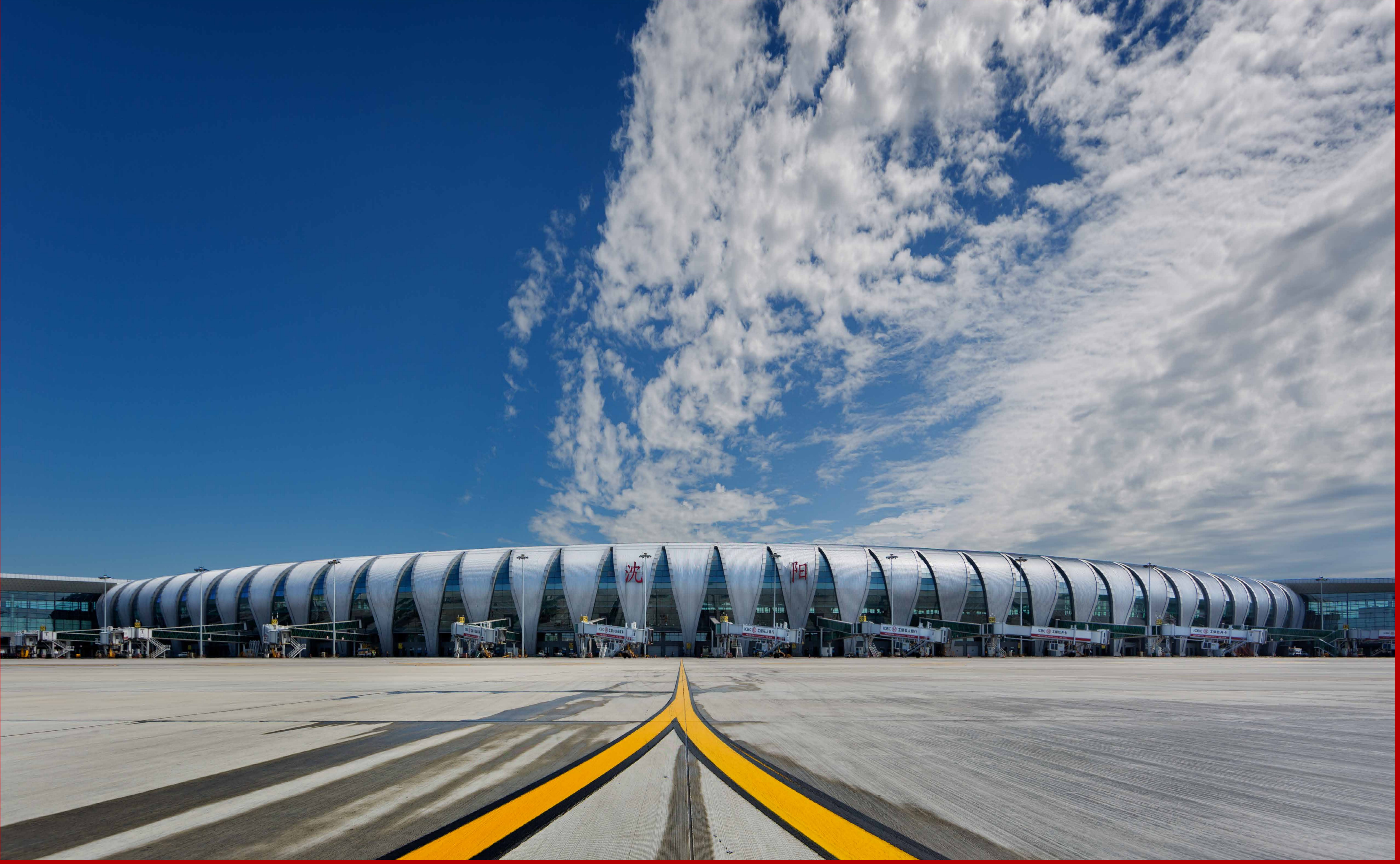
沈阳桃仙国际机场 T3 航站楼 沈阳桃仙国际机场是辽宁省对外交流的重要窗口，为提升沈阳乃至辽宁形象起到重要的促进作用。图为沈阳桃仙国际机场 T3 航站楼