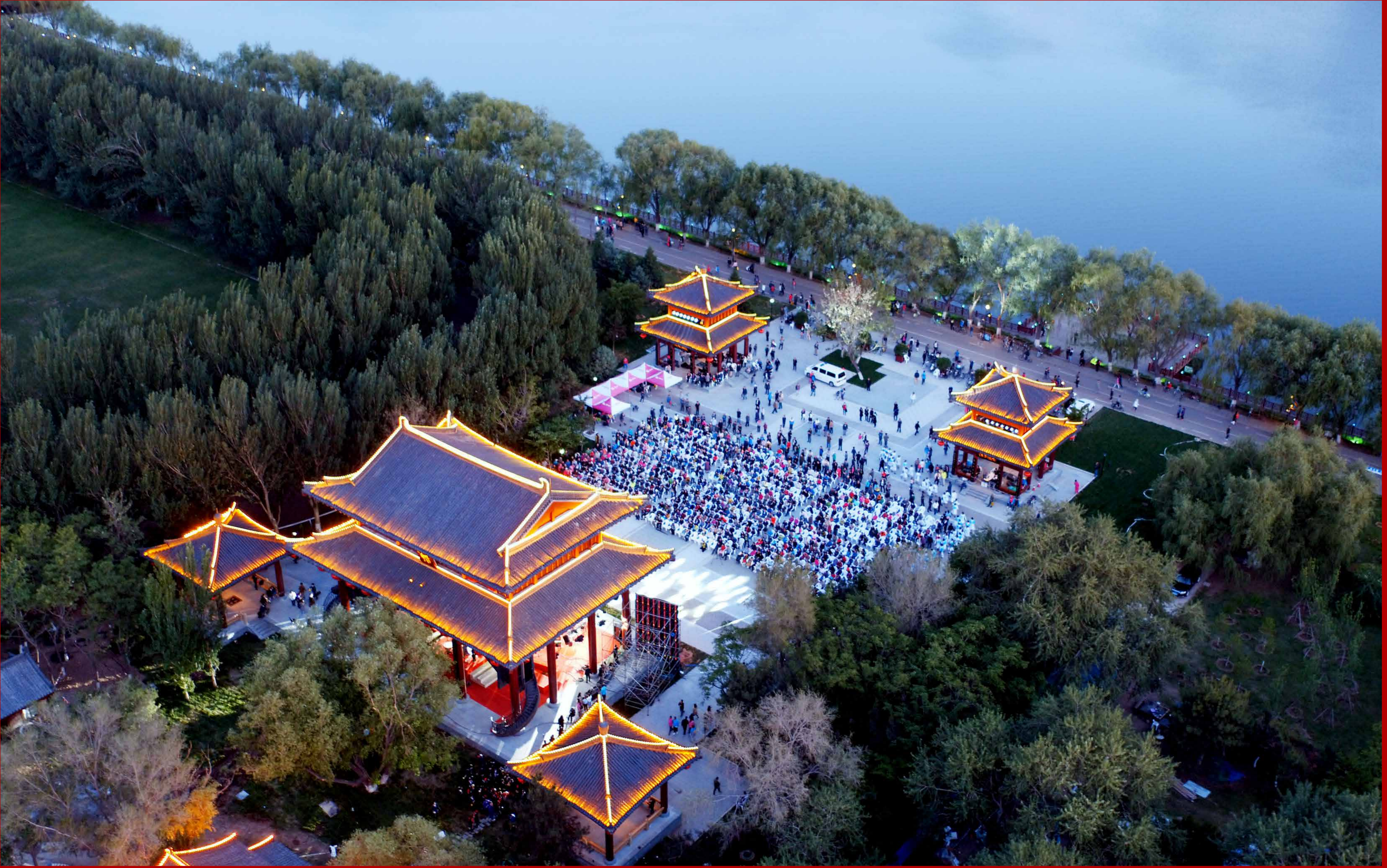
云颶閣 云颶閣是沈阳浑河岸边的新地标建筑，整体为辽代建筑风格，在屋顶、斗拱及巨大的建筑形体上体现“协力同心、分担共举”的浓郁辽风。