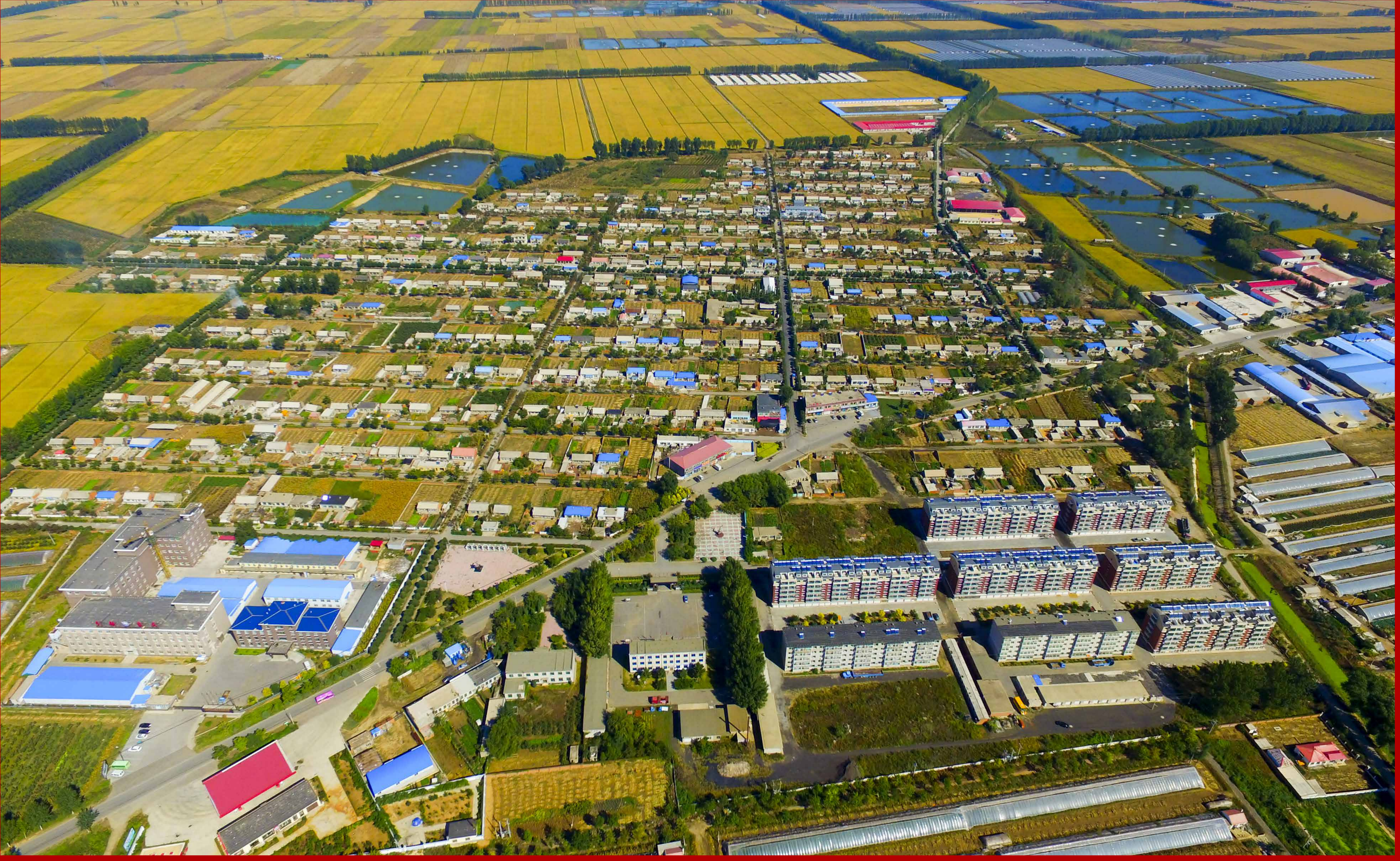
辽中区养士堡乡养前村