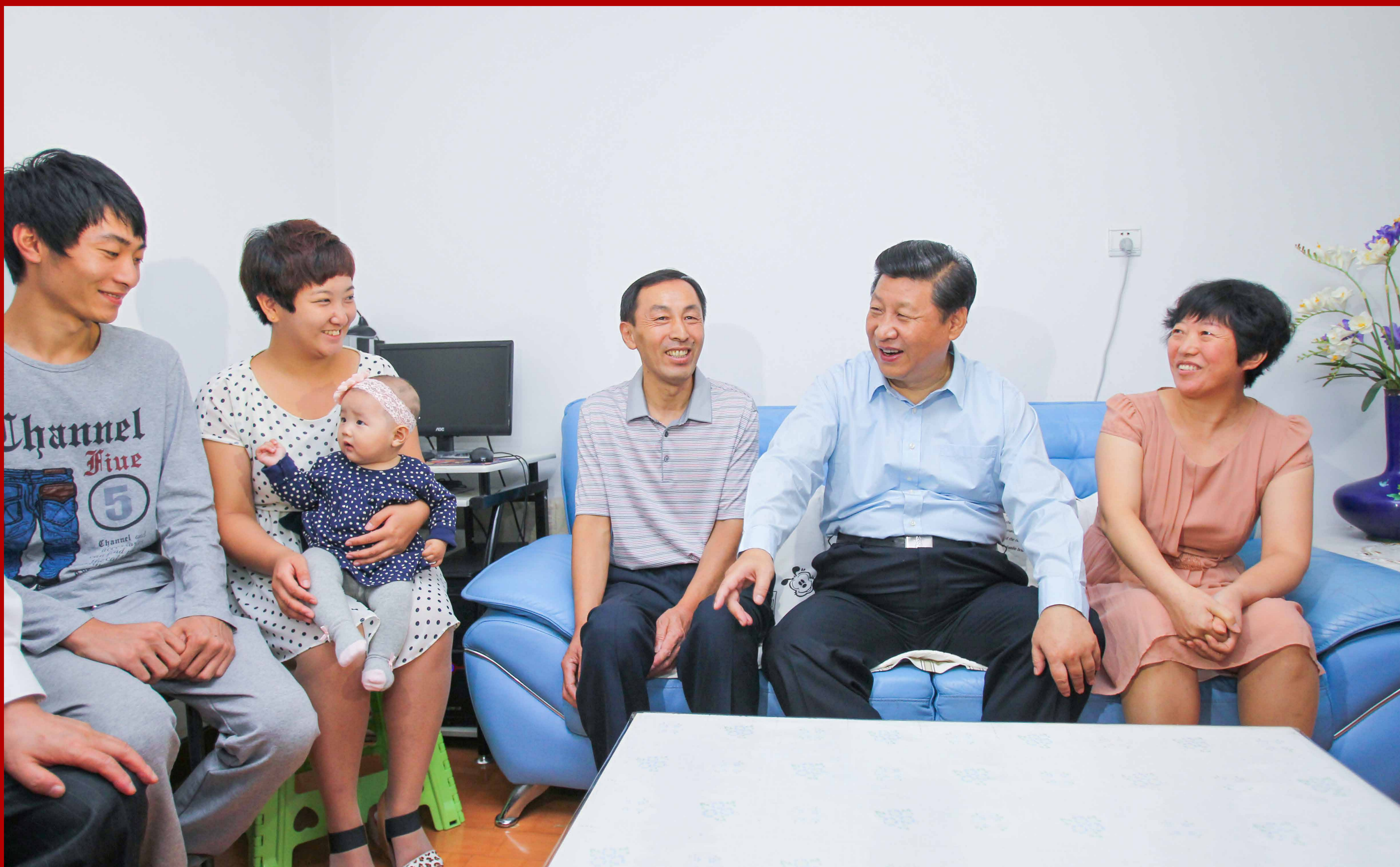
2013年8月，习近平总书记视察辽宁，专程来到沈阳市沈河区多福社区考察，他指出：社区建设光靠钱不行，要与邻为善，以邻为伴。