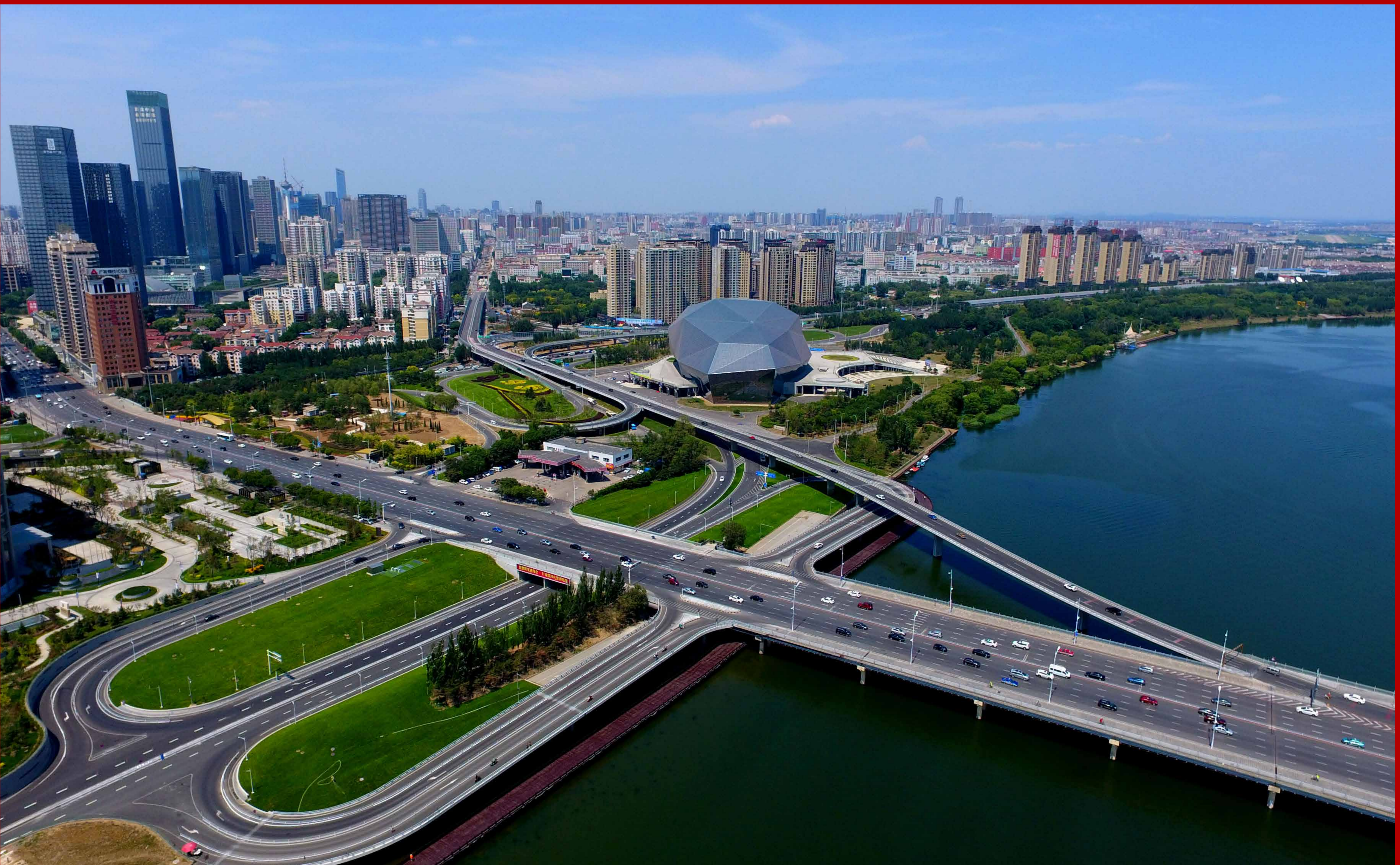
从空中俯瞰的青年大街浑河桥