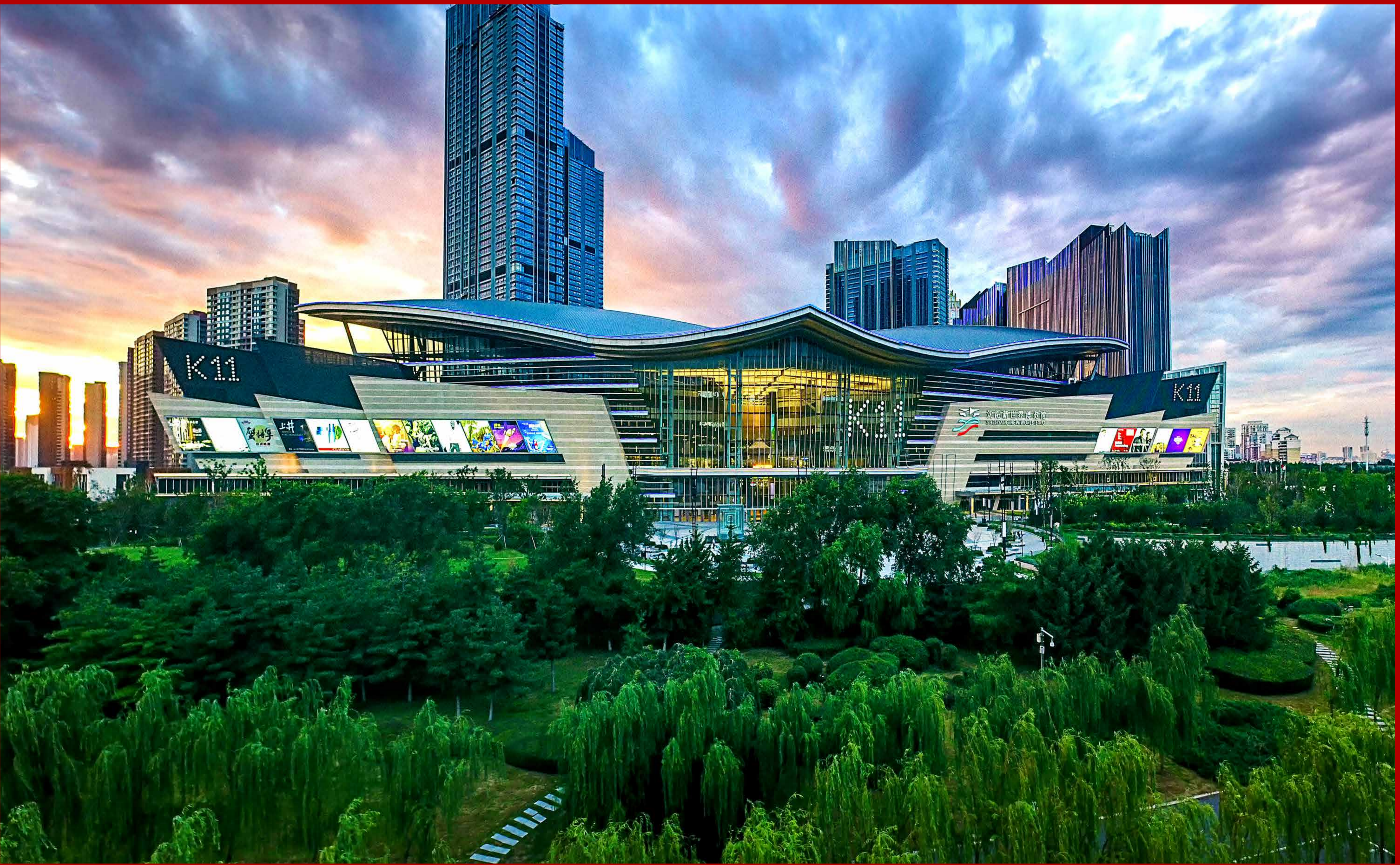
沈阳新世界展览馆