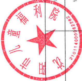
部门（单位）整体绩效目标表